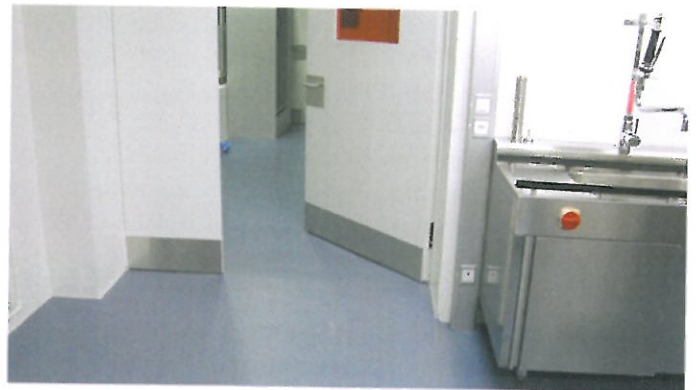
Labor in Bern Küchenfläche: 545 m 2