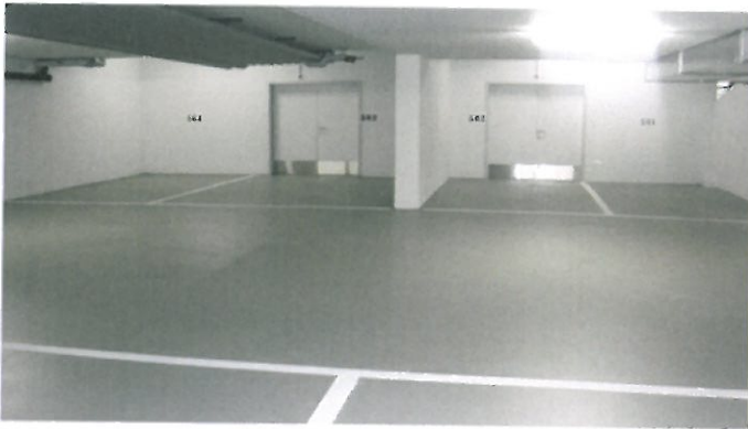
Parkhaus City Nord, Grabengut, Thun Fläche: 669 m 2 , Detailabdichtung: 139 m

Flachdach • Steildach • Fassade • Spenglerei • Blitzschutz • Flüssigkunststoff • Kundendienst • Gerüstbau