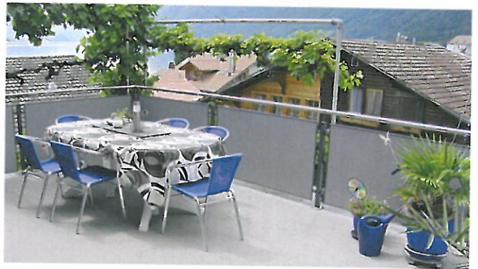
Balkonsanierung in Brienz Fläche: 37 m 2 , Detailabdichtung: 30,4 m