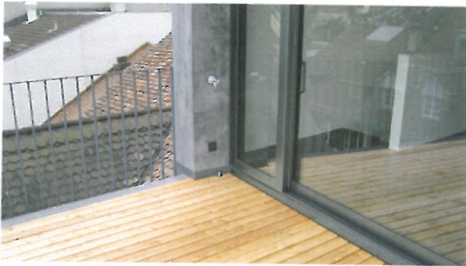
Sanierung Wohn- und Geschäftshaus Bälliz, Thun Detailabdichtung: 205 m