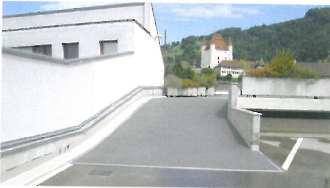
Parkhaus City West, Aarestrasse, Thun Rampenfläche: 58 m 2 , Detailabdichtung: 39 m