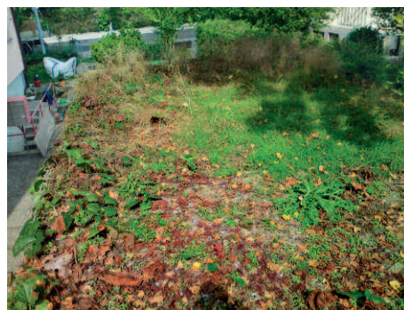
Der Fremdwuchs dieser extensiven Begrünung war derart gross, dass nur noch eine Gesamtsanierung möglich war.

Lassen Sie es nicht soweit kommen, unser Kundendienst hilft Ihnen gerne weiter!