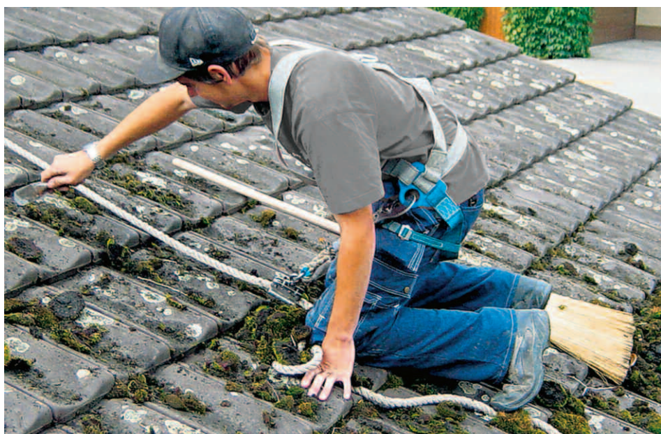
Die regelmässige Dachreinigung verlängert die Lebensdauer des Daches nachweislich. Doch lassen Sie diese Arbeiten durch einen Fachmann verrichten, der weiss, wie man sich sicher auf einem Dach bewegt! Ihrer Gesundheit zuliebe.

Lassen Sie es nicht soweit kommen, unser Kundendienst hilft Ihnen gerne weiter!