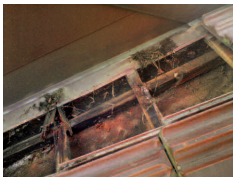
Verschmutzungen am Anschlussblech führten zu Wassereintrich und Fäulnis der Lattungen.